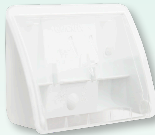
Plum QuickFix Uno, transparent