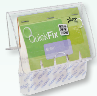
Plum QuickFix SOLO®, transparent - abgebildet mit Beispiel für Pflaster- nachfüllung