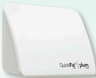
Plum QuickFix Uno, weiß

Ein Plum QuickFix Pflasterspender bietet einen strukturierten Ansatz für die Erste Hilfe bei kleineren Verletzungen. Es handelt sich hierbei um ein flexibles System für Arbeitsplätze, an denen Staub und Schmutz keine Rolle spielen. Sowohl der Plum QuickFix Uno als auch der Plum QuickFix SOLO® sind kleine Spender, die Sicherheit am Arbeitsplatz mit moderner Optik kombinieren.